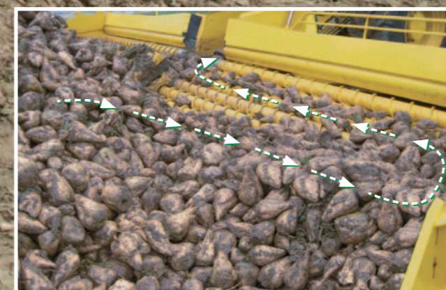
Dubbel renslängd i inmatningen