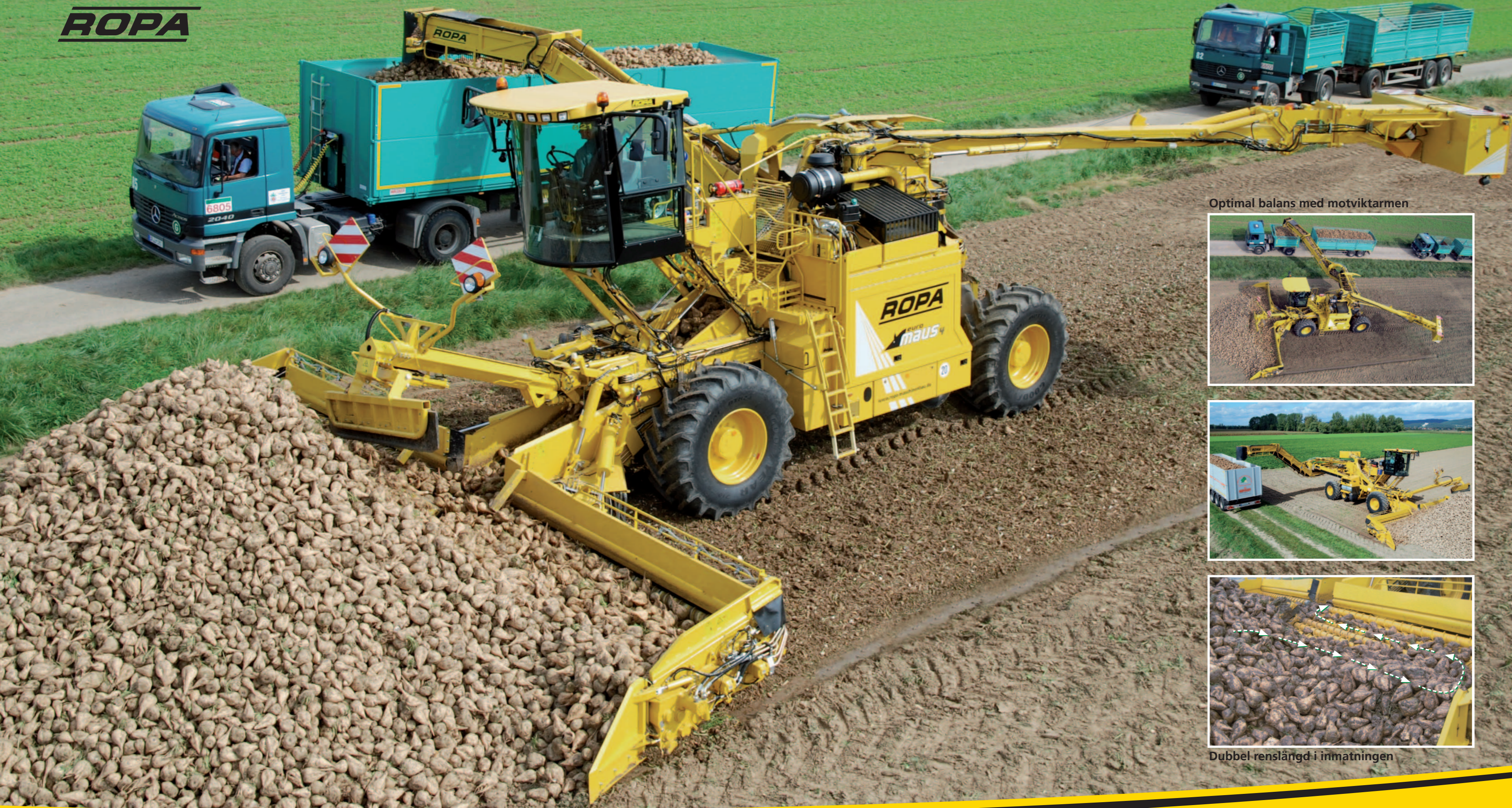
Optimal balans med motviktarmen