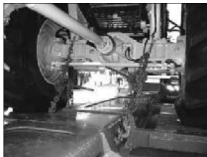
Vorderachse von hinten