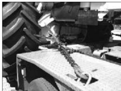
Verzurrung mit Spannkette