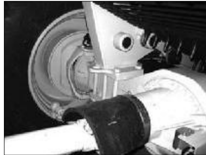
Vorderachse von hinten