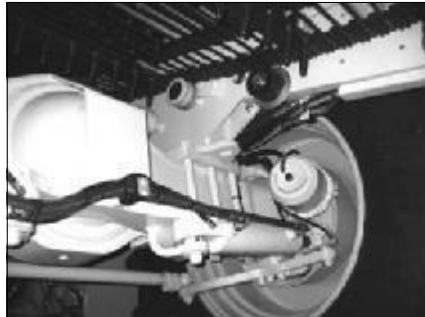
Vorderachse von vorn