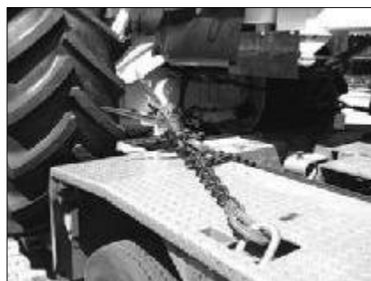
Verzurrung mit Spannkette