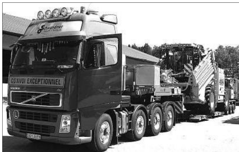
Vorschriftsmäßiger Transport mit Spezialtieflader (Fabrikat Goldhofer)