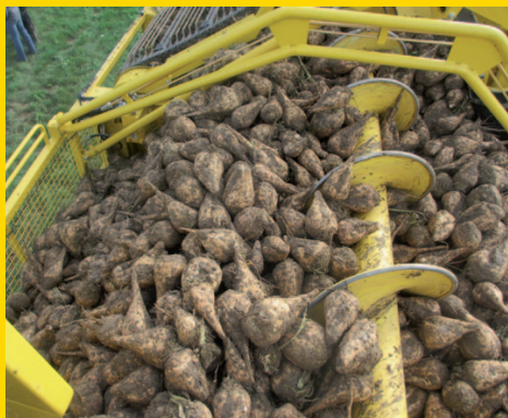
Ernteergebnis mit Entblatter!