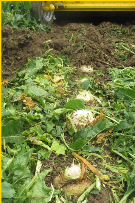
Die Rübenblätter werden mit Gummischlegel vom Rübenkörper abgeputzt.